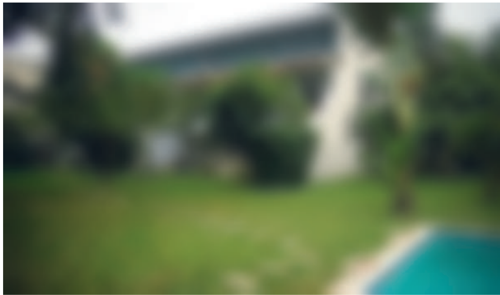
Vastgoedinvesteringen zijn in Kinshasa snel terug te verdienen. De huur voor 160 m 2 bedraagt ongeveer 4.000 euro per maand. Dat is twee keer duurder dan in Knokke.