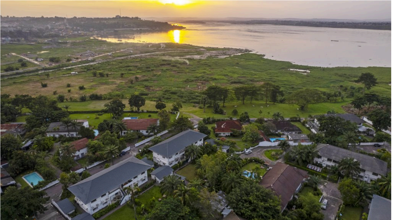
Het vastgoedcomplex van Texaf aan de Congostroom in Kinshasa.