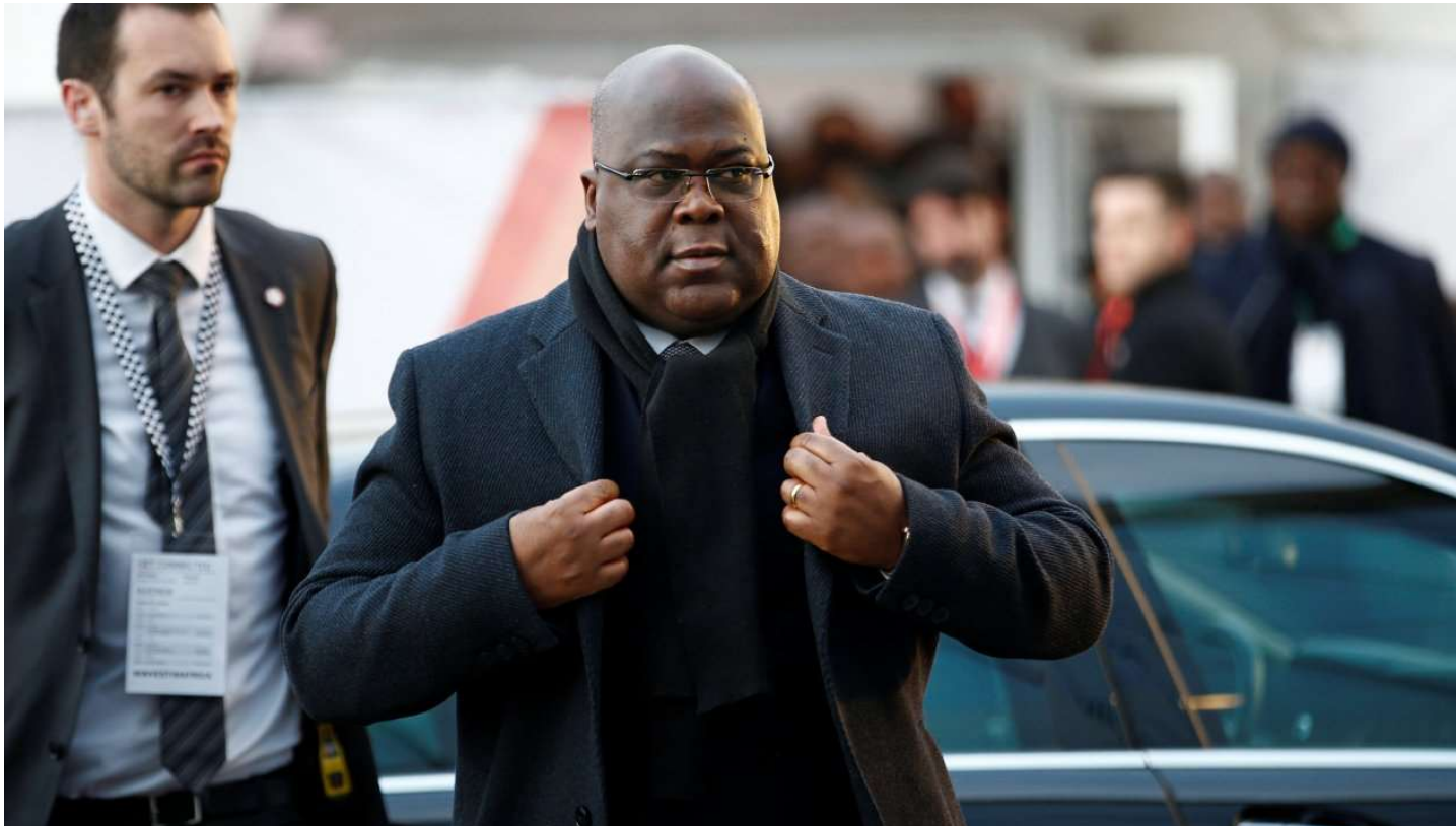
De Congolese president Félix Tshisekedi bij een bezoek aan Londen in januari.

KOEN LAMBRECHT | 04 september 2020 09:31