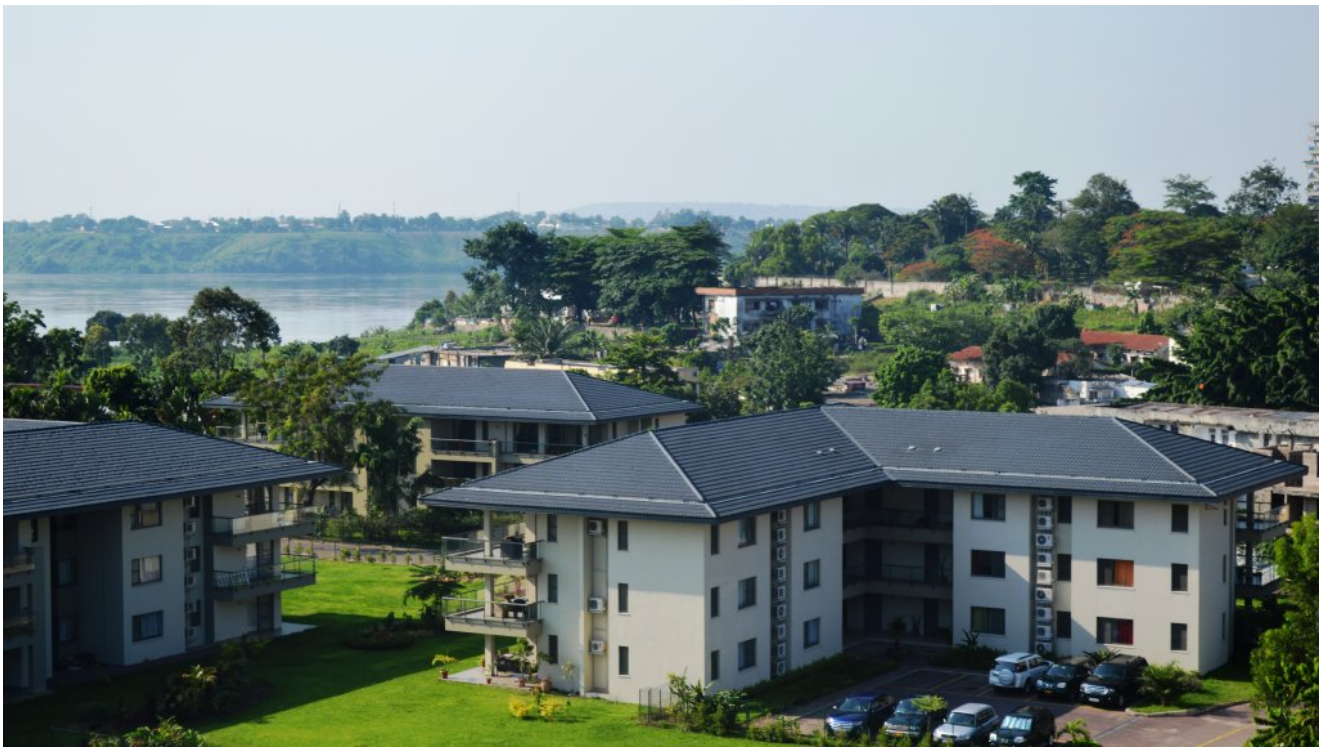
Appartementen in de concessie van Texaf in Kinshasa.