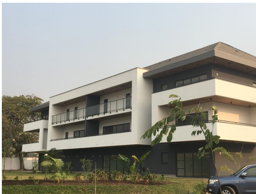
Immeuble appartement achevé du projet « Bois Nobles »