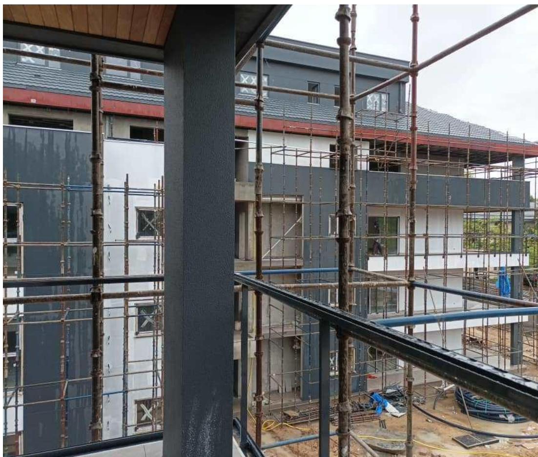
Chantier Promenade des Artistes Bâtiment D