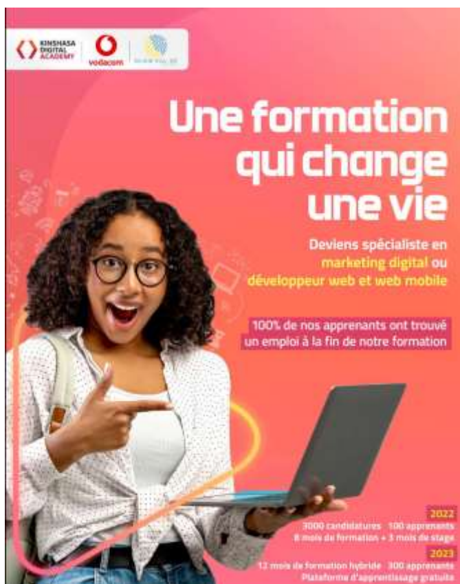
Partenariat avec Kinshasa Digital Academy