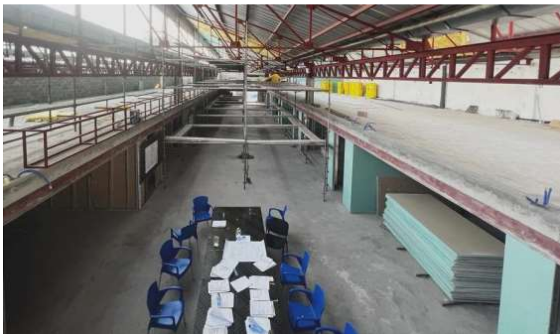
Chantier Silikin Village III