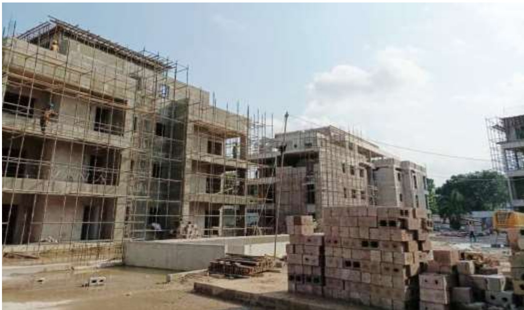
Chantier Promenade des Artistes

En dépit de ces projets ambitieux qui contribuent au rayonnement international de Kinshasa, le groupe fait face à des tentatives, de plus en plus agressives, d'opportunistes de spolier deux de ses actifs fonciers : le terrain non constructible entre sa concession UTEXAFRICA et le Fleuve, et une partie de son terrain à Kinsuka, dans la banlieue ouest de la ville, sur lequel il a un projet de promotion-vente de 2.000 logements pour la classe moyenne kinoise. Ce projet est ralenti par l'incertitude que provoquent ces tentatives qui nuisent gravement au climat des affaires.