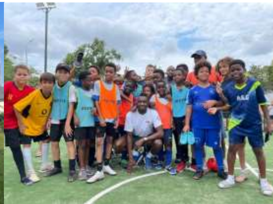
Blaise Matuidi qui a inauguré le terrain multisport