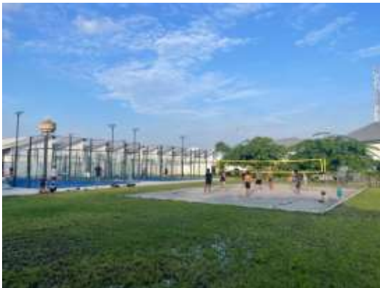
3 terrains de Padel et 1 Volley-ball