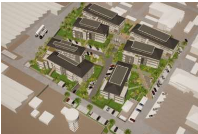
Projet Promenade des Artistes