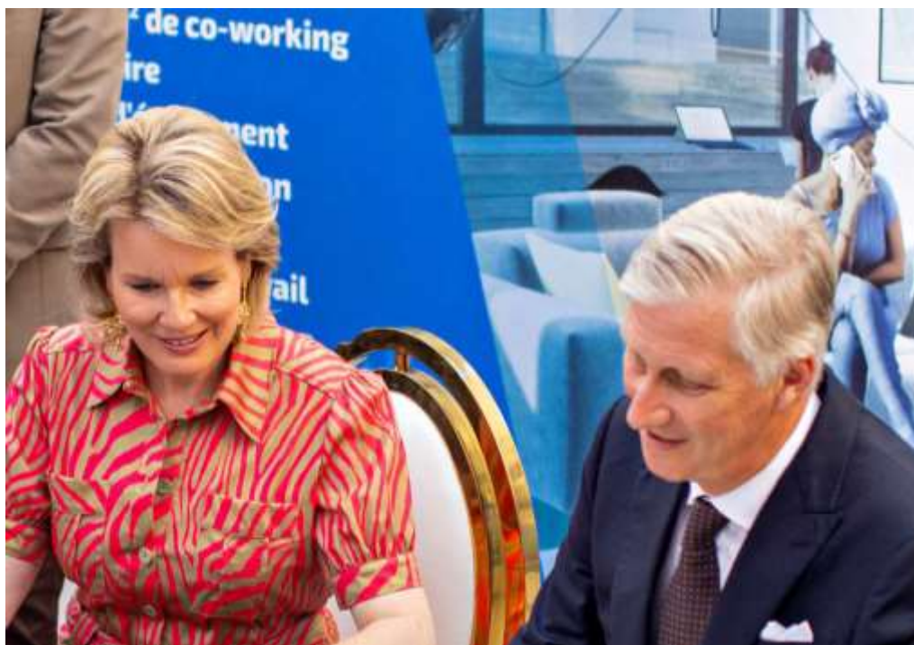
SM le Roi des Belges et la Reine au Silikin Village

OPEN ACCESS DATA CENTRES – TEXAF DIGITAL et le fournisseur d'équipements informatiques reconditionnés CTG-TEXAF.