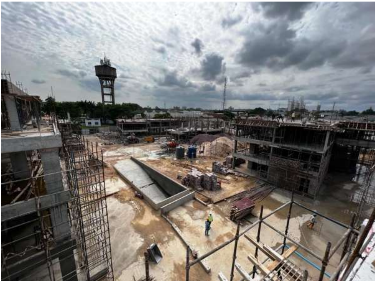
Chantier Promenade des Artistes

La construction des deux plus grands projets du groupe, à savoir la phase 3 du SILKIN VILLAGE et Promenade des Artistes (94 appartements) se poursuit. SILKIN VILLAGE III a été divisé en deux phases d'exécution dont la 1 ère sera livrée en septembre 2023 et la 2 ème en 2024.