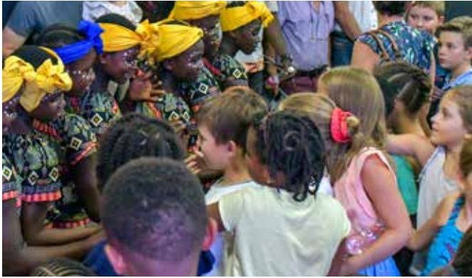
De kinderen van de Concession oog in oog met de Bana Congo.