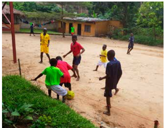
Activiteiten om het straatgeweld te vergeten.

De vereniging organiseert ook activiteiten en ludieke leerlessies. Tijdens dergelijke momenten van ontspanning kunnen de kinderen weer leren openhartig zichzelf te zijn.