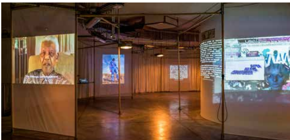
Onder impuls van jonge YouTubers brengt de kunstenuimte AfricaTube het hedendaagse digitale Afrika voor het voetlicht.