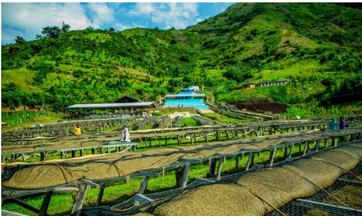
Een koffiewasserij vanaf de onderkant gezien.

Dit uitgangspunt ligt ten grondslag aan de activiteiten van de vzw, die kleine koffieboeren aanmoedigt om op hun landbouwgrond te werken en in de buurt kleine koffie-wasserijen te bouwen, die zij cofinancieren. Dit alles verloopt volgens de principes van goed bestuur, in samenwerking met lokale specialisten en landbouwcoöperaties. "Er zijn meerdere doelstellingen" , zegt Thierry Beauvois. "Hierdoor worden tijdrovende verplaatsingen verminderd, verloopt de transportketen sneller en verbetert zowel de kwaliteit als de prijs voor de producenten."