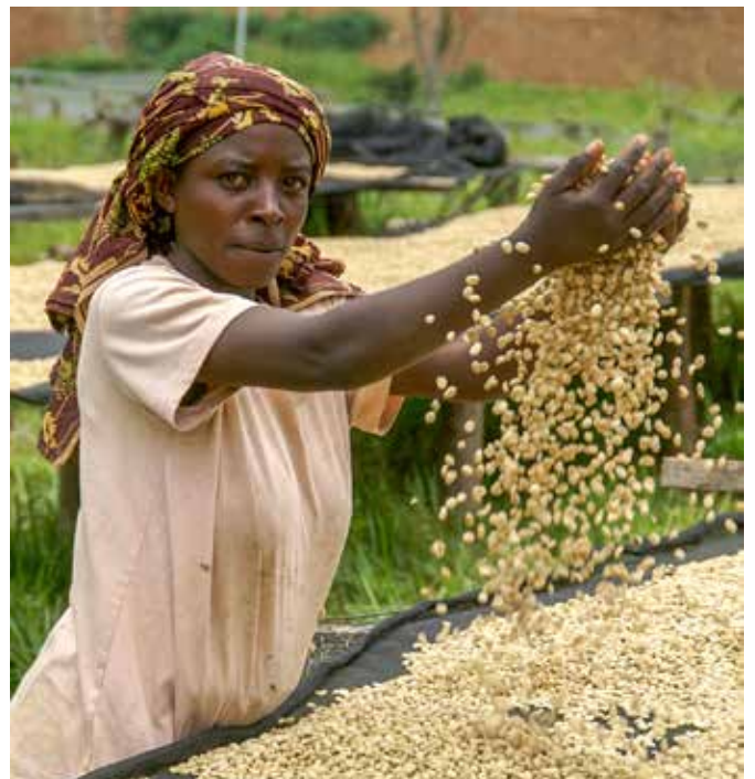
Een sorteester in de koffiewasserij.

Na het succes van een middelbare-schoolbibliotheek in Minova met meer dan 12.000 boeken, is er in 2018 een nieuwe speelgoedbibliotheek gelanceerd. Daar is aan alles gedacht om kinderen te vermaken met educatieve en creatieve gezelschapsspellen. Ook heeft Comequi in de partner-basisscholen 8 minibibliotheeken geïnstalleerd.